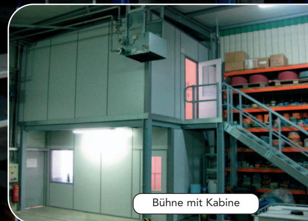
Bühne mit Kabine